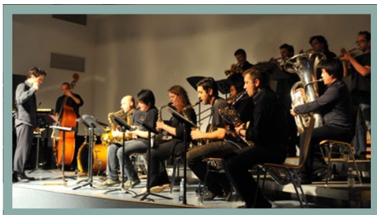
CONCERT DU BIG BAND, JUN 2011