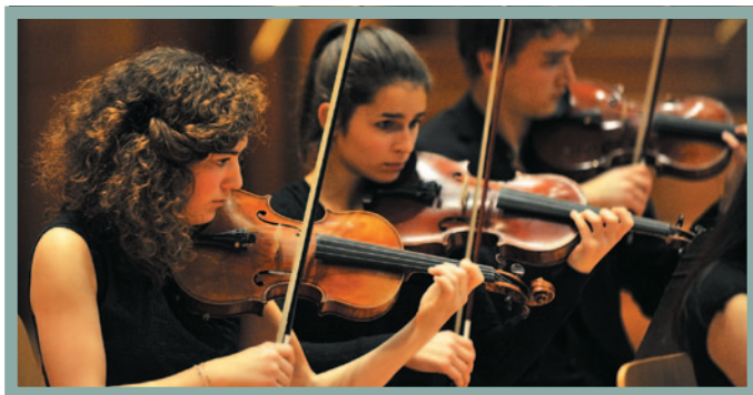
CONCERT DE L'ORCHESTRE SYMPHONIQUE, DÉCEMBRE 2011.

Directions : Arnaud Tutin et Aurélien Azan Zielinski